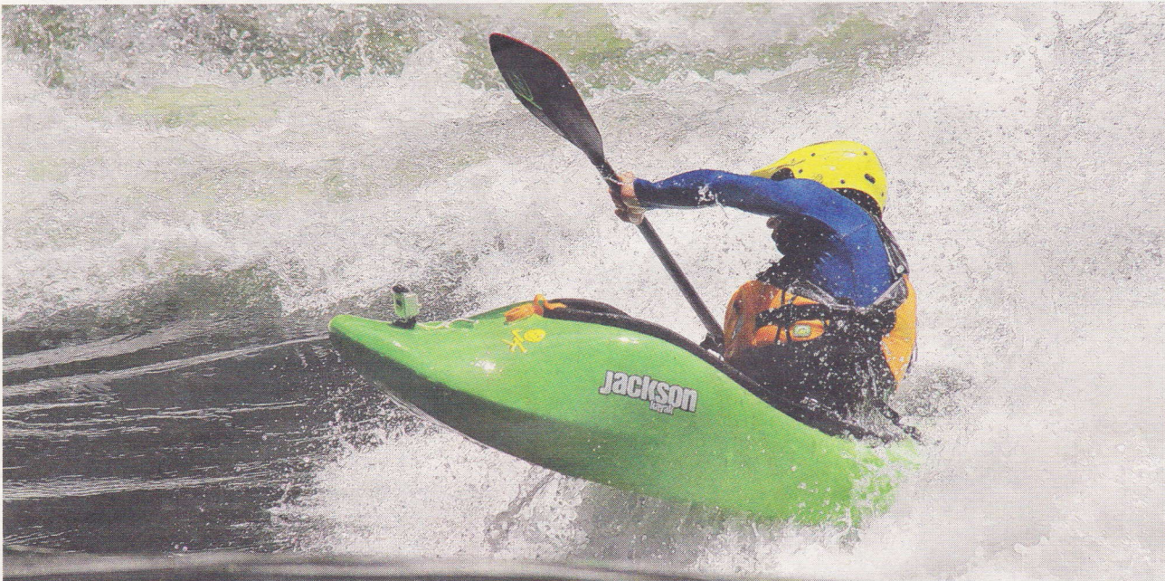
Die ersten zwei sehr schwierigen Schnellen, die sogenannten «minus Rapids», direkt unterhalb der Viktoriafälle, werden nur von den weltbesten Paddlern bezwungen.