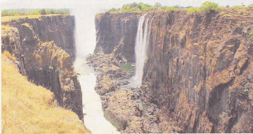
Direkt unterhalb der Viktoriafälle beginnt man beim offiziellen Einstieg mit der Stelle 1 zu zählen.